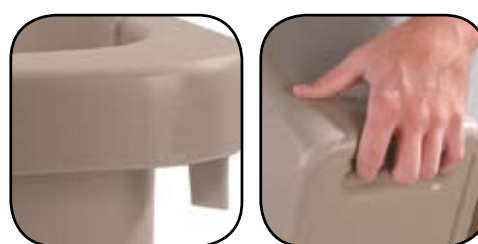
Manico di supporto